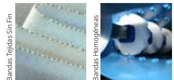
Bandas Tejidas Sin Fin