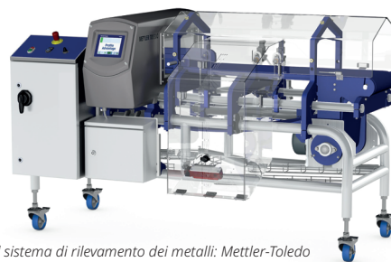
Fornitore del sistema di rilevamento dei metalli: Mettler-Toledo

AS = Antistatico; FG = Adatto al Contatto con gli Alimenti; M1 = Finitura Opaca; MD = Rilevabile al Metal Detector