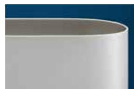
Ammeraal Beltech KleenEdge

Testresultaten voor rafelen / duurzaamheid*: