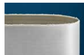
Soortgelijke band van de concurrent

*resultaten verkregen na vergelijkend laboratoriumonderzoek