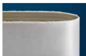
Miglior nastro del principale concorrente

*risultati ottenuti dopo aver sottoposto entrambi agli stessi test di laboratorio