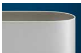
Nastro Ropanyl Premium

Risultati dei test di resistenza allo sfilacciamento ed usura*: